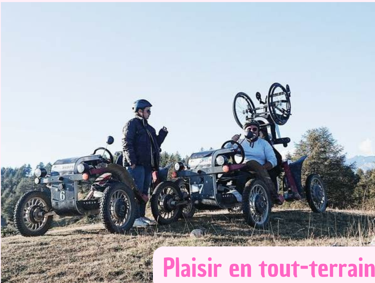
Plaisir en tout-terrain